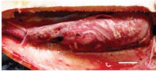
Рис. 3. Воспалительная реакция организма рыбы на инвазию Philonema spp.l. у кунджи из оз. Киси (масштаб: 3 см)

Несмотря на удручающее впечатление от вида брюшной полости исследованных гольцов, которые были инвазированы филонемами, даже в случаях обнаружения нематод в сердечной сумке, сами рыбы видимых