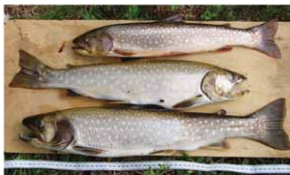
Рис. 2. Кунджа из оз. Киси

Philonema spp. I [13]. Они были представлены самцами, молодыми самками и самками, содержащими как эмбрионов на разных стадиях развития, так и зрелых личинок.