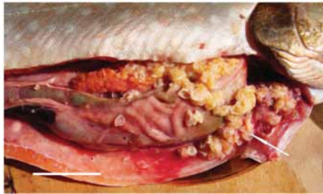
Рис. 4. Кунджа из оз. Киси с невыметанной икрой (стрелка – филонема среди остаточной икры; масштаб: 5 см)

больших проблем не испытывали. Они были вполне упитаны, вдоль желудочно-кишечного тракта тянулись жировые ленты.