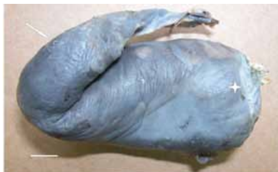
Рис. 5. Висцеральные органы брюшной полости тела мальмы оз. Чистое в «коконе» (стрелка – часть тела филономы вышла из-под «кокона»; звездочка – часть «кокона», обращенная к голове рыбы; масштаб: 1 см)

Ряд исследователей указывают на отсутствие признаков патологии у крупных и зрелых, пришедших на нерест, рыб, а у незрелых лососей, напротив, отмечают интенсивный процесс образования висцеральных спаек [27, 31, 34, 35]. Предполагается, что висцеральные спайки исчезают у созревших лососей [34], однако, с этим нельзя согласиться без оговорок. По нашим данным, к моменту нереста гольцов в их брюшной полости, вне «кокона», находятся, главным образом, единичные самцы,